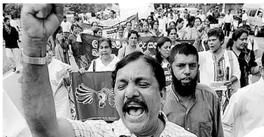
Des centaines de personnes de différentes communautés ont manifesté pour la paix, hier à Colombo.

L'armée sri-lankaise a affirmé hier qu'elle avait tué 98 rebelles tamouls. Ceux-ci avaient lancé, dans la nuit, une offensive dans la péninsule de Jaffna, au nord du Sri Lanka,