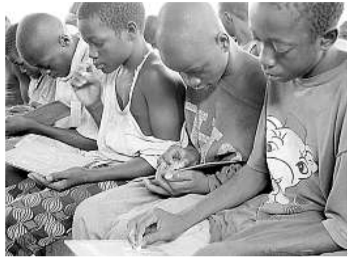
Trois fois par semaine, les enfants peuvent suivre des cours d'alphabétisation. Ils y viennent de plus en plus.

L'avenir des gamins de la rue n'est pas tracé. Devenus adultes, ils peuvent finir en prison, être tués mais tout aussi bien se faire gendarmes ou policiers. « Ou devenir